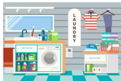
Zona de ropa